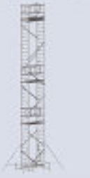
Módulo A + B + C + D + E