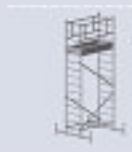
Módulo A + B