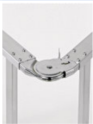
Bisagra módulo K (Ref. 44509)