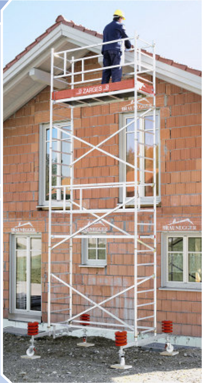
Módulos A + B + C + D + E