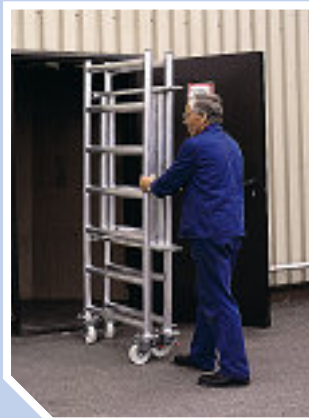
Módulo plegable, K